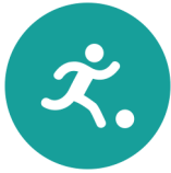
Spel en beweging/ bewegingsonderwijs